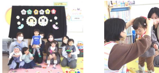
※昨年度の様子です。

3月22日(金)は、今年度サークルに遊びに来てくれた方々とのおわかれ会を予定しています。記念写真を撮って貼ったり、メッセージを書いたりして、思い出のカード作りをします。今年度で活動の参加が最後の方はぜひご参加ください。